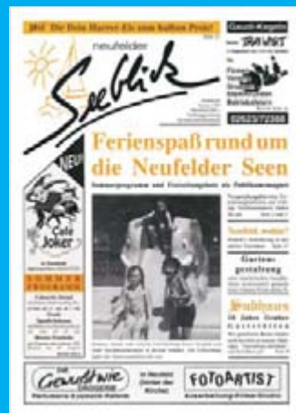
Ausgabe 1 - Juni 1993