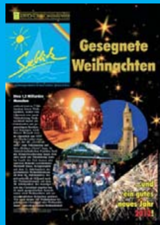
Ausgabe 92 - November 2011